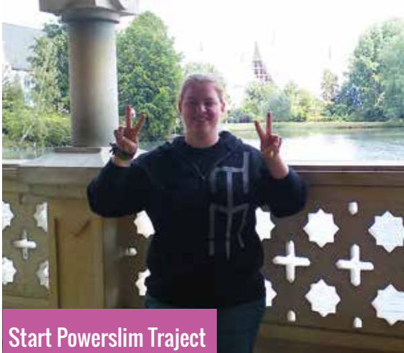
Start Powerslim Traject