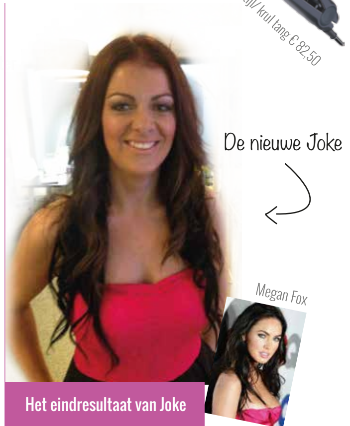
De nieuwe Joke