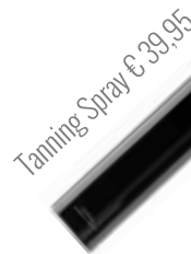
Taming Spray € 39,95