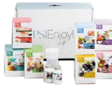
Powerslim v.a € 75,- per week