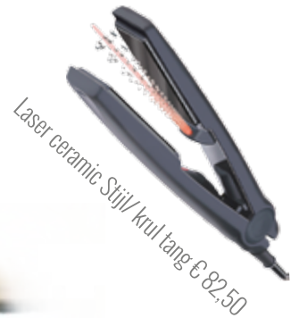
Laser ceramic Stijl/krul tang € 82,50